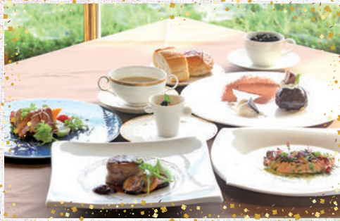
クリスマス特別ディナー(イメージ)