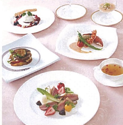
レストランにてお食事、屋外観覧席にて観覧