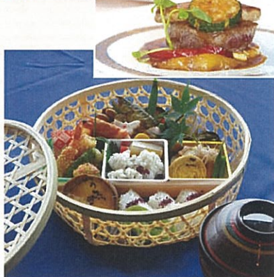
多目的ホール桃山にてお食事、屋外観覧席にて観覧