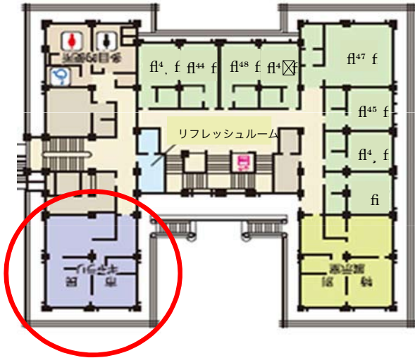
市民ギャラリー間取り図 (3F)

※大津市外に在住の方も、予約状況によりご利用いただける場合がございます。詳しくはお問合せください。